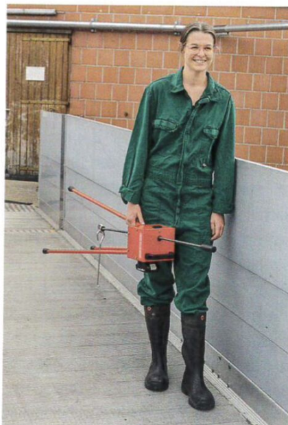
Das 6,7 kg leichte und gut austarierete Gerät lässt sich bequem von Stall zu Stall tragen.

Für den Fall einer Überlastung besitzt das Gerät eine thermische Sicherung. Sollte sie auslösen, lässt sie sich nach einer Pause per Knopf zurücksetzen. Laut Hersteller