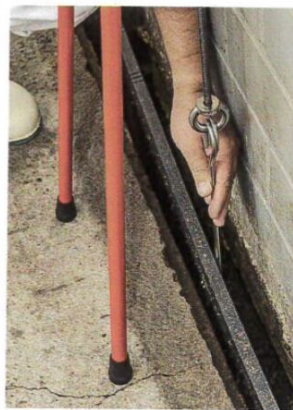
Die Stahlhaken übertragen bis zu 1000 N Zugkraft.

konnten wir so ohne Hektik aufstehen, um dann mit geradem Rücken zum Ziehen des Schiebers überzugehen.