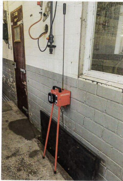
Bei wandständigen Schiebern stützt sich der Schieberzieher an der Mauer ab.

Das Zusammenspiel von Motor und Spindel gefällt uns gut. So lassen sich nach dem Einfädeln in die Schieberösen die Haken zunächst gefühlvoll „auf Zug“ bringen. Aus der gebückten Haltung beim Einhängen